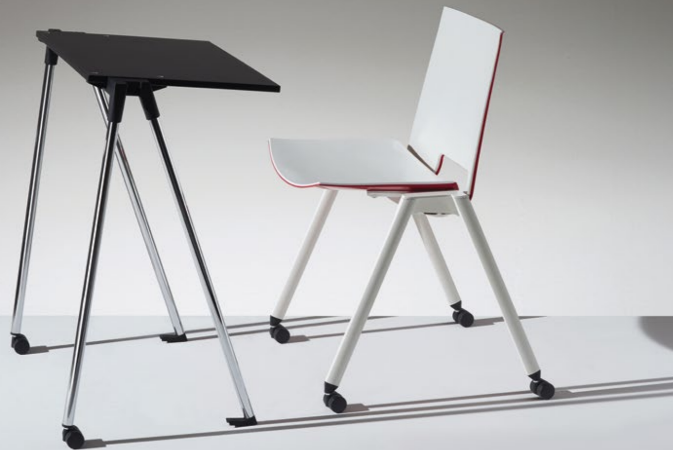
Lucky Tables Emilio Nanni